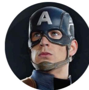
Captain America Assistant