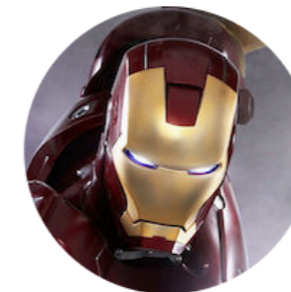
Iron Man Assistant